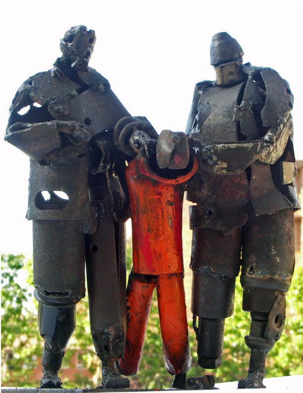
Zu sehen: "Guantanamo". Eine Skulptur von José Antonio Elvira.

Ein klarer Fall der Verletzung der Menschenwürde stellt Folter dar: Im internationalen Strafrecht ist Folter gemäss der UN-Antifolterkonvention (Convention against Torture and Other Cruel, Inhuman or Degrading Treatment or Punishment) verboten und muss verfolgt werden – zumindest für die Länder, welche den Vertrag ratifiziert haben (momentan 155 Staaten (16)).