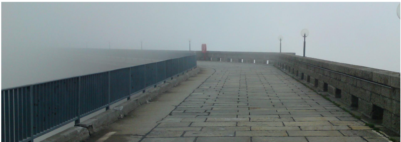
Die heutige Grimselstaumauer.

An sich ist dies ein Ziel, das u.a. durch Umweltverbände mitgetragen wird. Jedoch stellen letztere sich gegen die Erhöhung der Grimselstaumauer: Aber wieso? (37) Wir gelangen zum Stichwort „Umweltverträglichkeit“ und möchten am Beispiel der Grimselstaumauer die aufgestellten Grundprinzipien (vorangehende Seite) anwenden. Doch zuerst möchten wir uns die einzelnen Standpunkte der Parteien vergegenwärtigen: